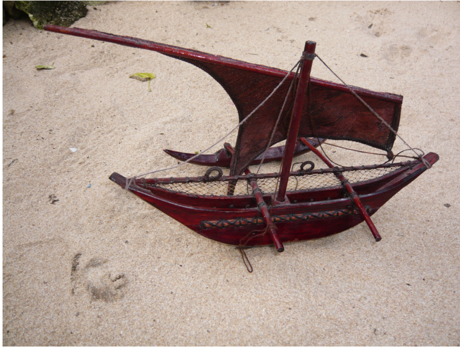
Katamaran aus Balsaholz