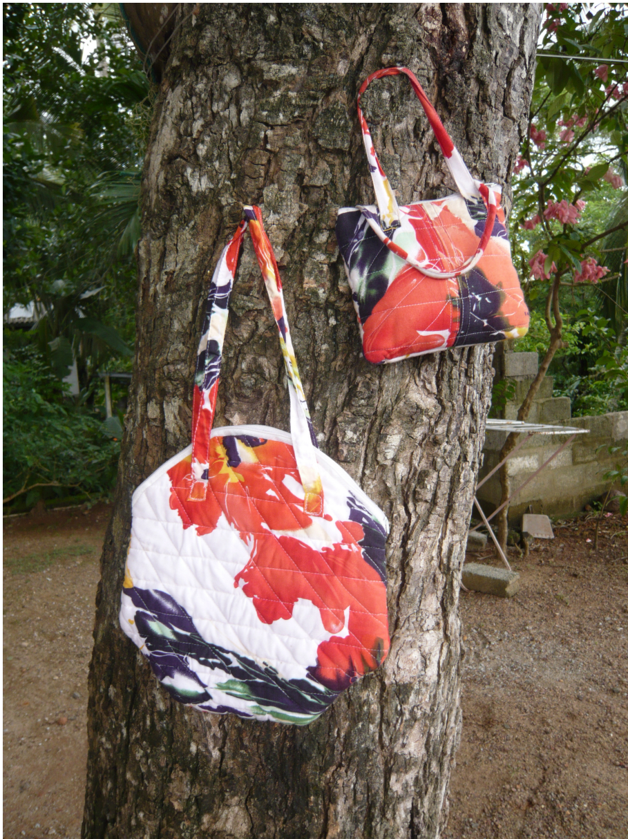
gesteppte Taschen mit Reißverschluss