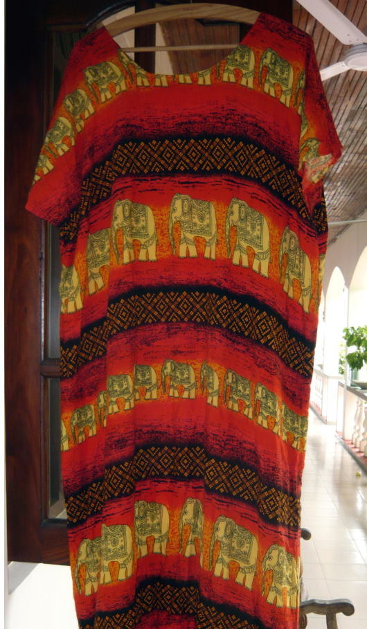
Kleid mit Elefantenmuster