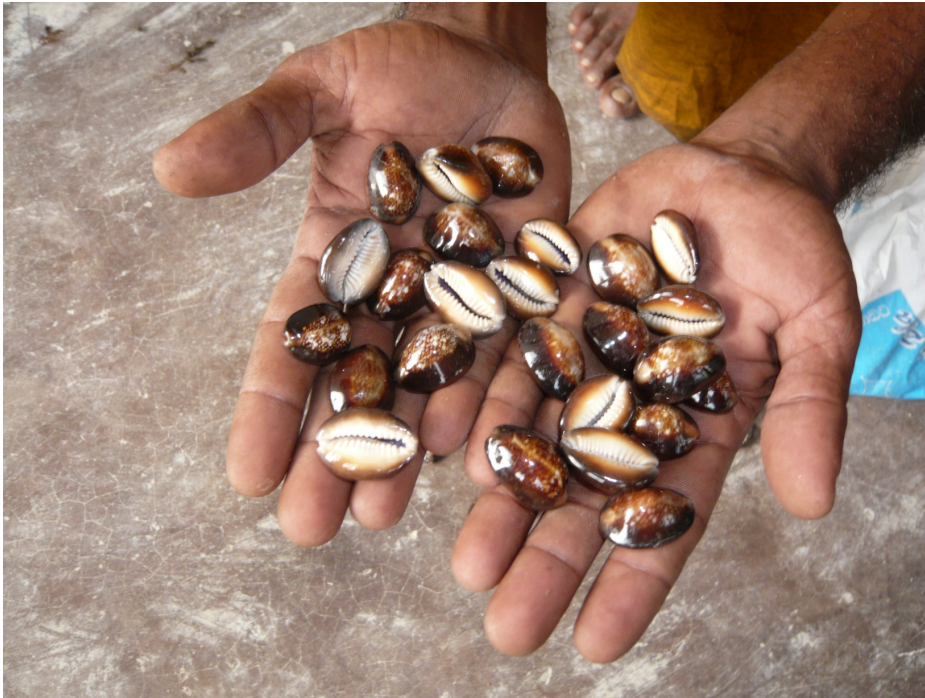
Muscheln, die Tata aus dem Meer geholt hat

Der Fischer springt dann von einem Felsen und holt die Muscheln aus etwa drei bis vier Metern Tiefe ans Tageslicht. Bei dieser gefährlichen Tätigkeit sind schon viele seiner Kameraden krank geworden.