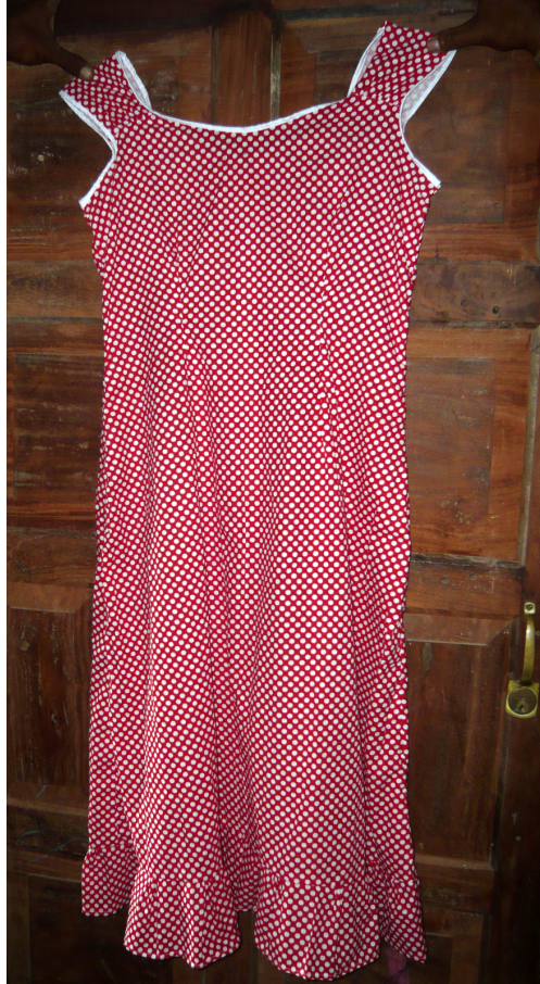
Sommerliches Kleid im Sri-Lanka-Stil