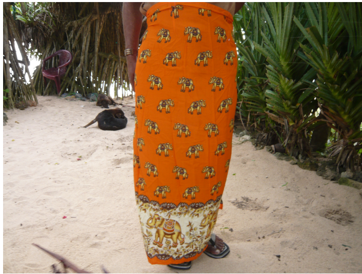
Auch auf diesem Rock fehlen die Elefanten nicht.